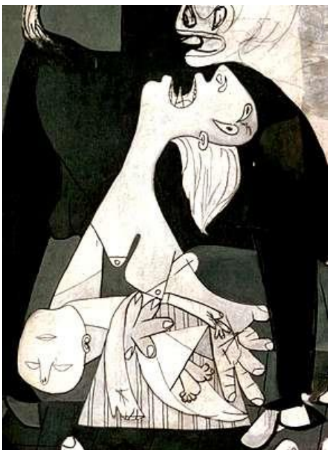
Pablo Picasso, Guernica (détail), 1937

Enfin le dernier chapitre s'articule plus directement aux avancées scientifiques et technologiques récentes qui modifient le rapport des hommes à l'environnement, à la société et à eux-mêmes. L'enjeu écologique, essentiel aujourd'hui, et des questions de bioéthique (clonage, transhumanisme...) pourront par exemple être abordées avec profit dans ce cadre.