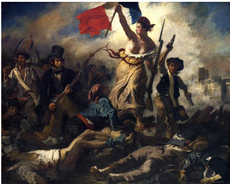
Eugène Delacroix , La Liberté guidant le peuple (1830)

L'étude de « la recherche de soi » se décline en trois chapitres, le premier consacré à l'éducation et aux idéaux d'émancipation héritiers des Lumières ; le deuxième aux nouvelles manières de sentir et à leur exploration, en particulier avec le romantisme ; le troisième aux aspirations et aux inquiétudes de l'âme moderne et au problème de la connaissance de soi, redéfini en profondeur notamment par la naissance et la diffusion de la psychanalyse.