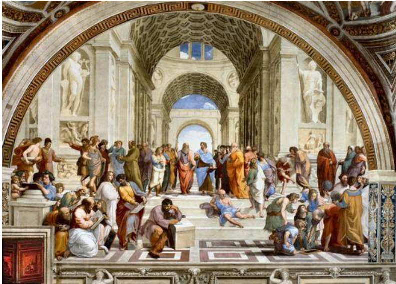
Raphaël, L'École d'Athènes