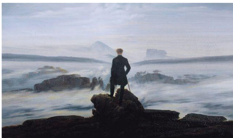
Caspar David Friedrich, Le voyageur contemplant une mer de nuages (détail)

http://www.lyc-fustel-de-coulanges-massy.ac-versailles.fr/wp-content/uploads/sites/8/2018/11/Programme-HLP-2.pdf